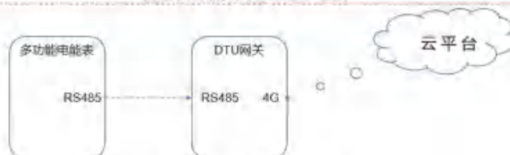
新增设备通信回路示意图