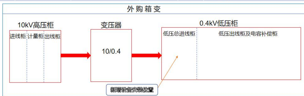
新增设备硬件安装位置示意图